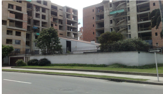
Inmueble sector Transversal 21 97 – 24

Contrasta la exclusión de los inmuebles anteriores, con la inclusión del ubicado en la Transversal 21 97 - 24, se encuentra fuera de contexto dentro de su entorno urbano, descontextualizada por su lenguaje arquitectónico, es claro que hace años la mayoría de edificaciones del sector eran casas de un piso o dos con un claro lenguaje arquitectónico definido, actualmente la edificación se encuentra rodeada de edificios de ocho y seis pisos, permitidos en el sector, conforme a políticas de la Secretaría Distrital de Planeación y Distritales con el propósito de densificar la ciudad y así disminuir los elevados costos que implicaría la construcción de infraestructura de la ciudad a la periferia de Bogotá. Para el futuro la conservación de esta casa aislada dentro del sector no corresponde a dichas políticas convirtiéndose en un elemento costoso para la ciudad sin representar valor arquitectónico, histórico o cultural como ocurrió con el inmueble de la Carrera 9 No. 88 - 14. Hay contradicción en la inclusión o exclusión de este tipo de edificaciones aisladas, que fueron absorbidas por el desarrollo urbanístico.