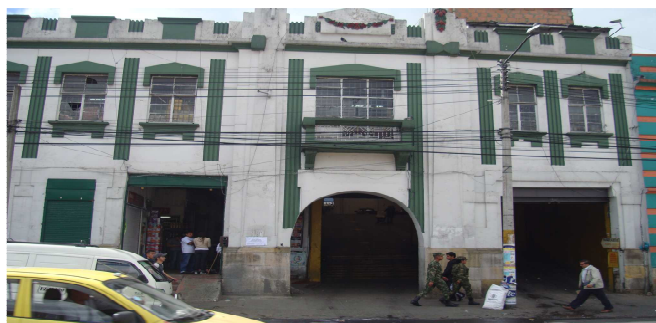
Carrera 18 No. 11/36/38/40/42

Los predios ubicados en la Calle 13 No. 17-50/52/54 y Calle 13 No. 17-60/64/66, De la Localidad de los Mártires, dentro del área delimitada para la formulación del Plan Parcial de Renovación Urbana, denominado la Sabana y se encuentran excluidos mediante Resolución 1075 del 29 Mayo /2009, expedida por la de la Secretaria Distrital de Planeación. En visita realizada a los inmuebles, se observó que presentan un alto grado de deterioro, abandono y ruina.