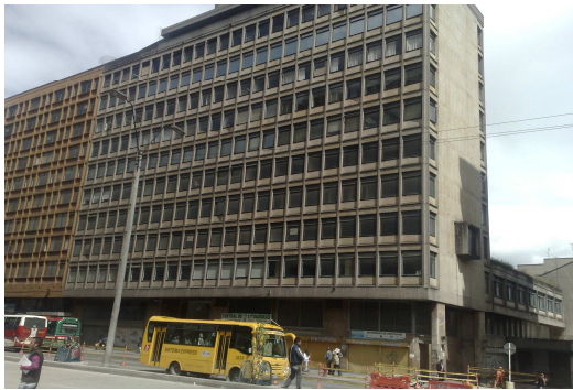
Carrera 10 19 – 49.

De acuerdo a las visitas realizadas a los Bienes de Interés Cultural-BIC de la muestra seleccionada, se encontraron deficiencias relacionadas principalmente con su conservación, como se muestra a continuación: