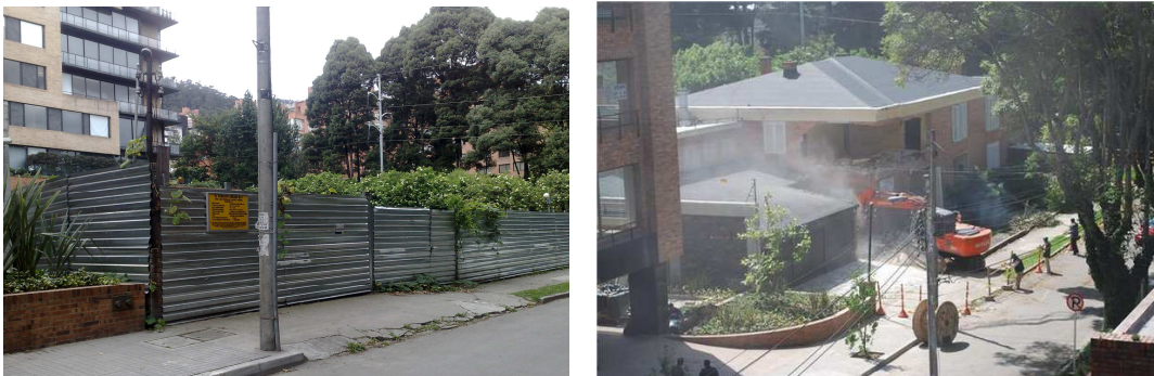
Visual actual Carrera. 9 88 – 14; visual del inicio de la demolición

Como resultado de la evaluación del proceso de exclusión de los Bienes de Interés Cultural, se encontraron inconsistencias de fondo, principalmente las relacionadas con las declaratorias de exclusión de bienes como de Interés Cultural y los valores cancelados por servicios públicos e impuesto predial.