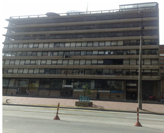
Carrera 10 20 – 30