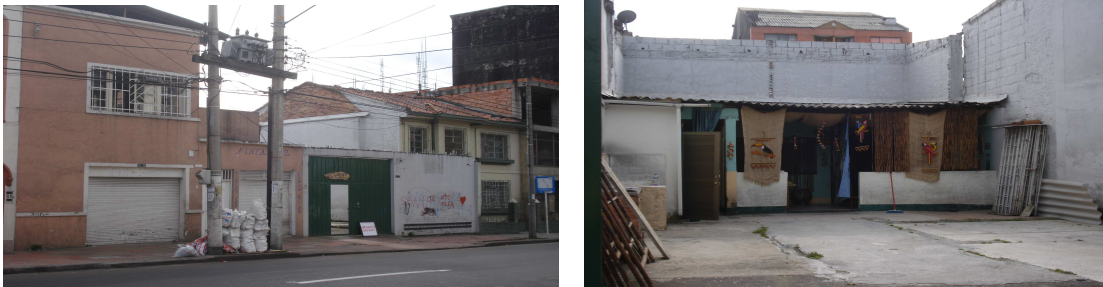
Carrera 16 No. 43-33

Según Visita Administrativa llevada a cabo por la Contraloría de Bogotá, D.C., en el mes de junio de 2011, se constató que el bien se encuentra demolido en su totalidad, conforme lo enseña el siguiente registro fotográfico