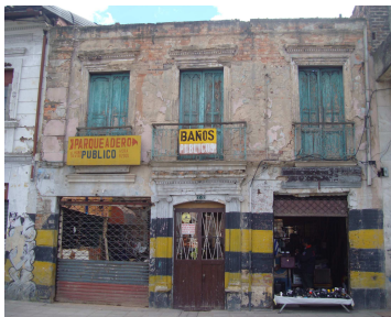
Cil. 12 18 – 38/40

De lo afirmado dan cuenta los siguientes registros fotográficos