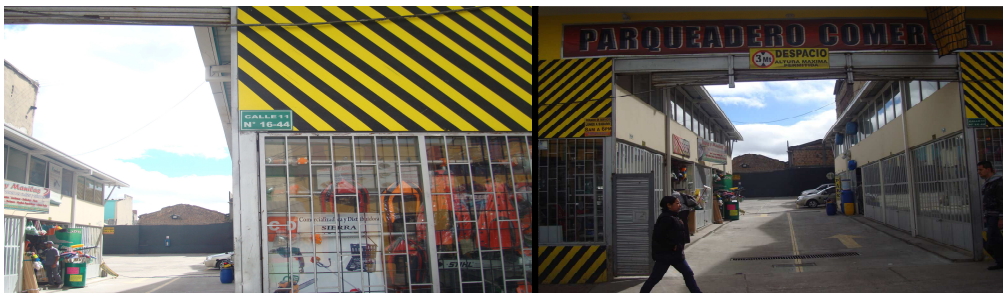
Calle 11 No. 16- 44/ 46/48/52

Es preciso señalar que con ocasión de la Visita Administrativa de carácter Fiscal, llevada a cabo por la Contraloría de Bogotá, D.C., en el mes de junio de 2011, al precitado predio, se tuvo la oportunidad de constatar que allí funciona una actividad económica distinta a la de vivienda, cual es la de parqueadero público. Hechos de los cuales da cuenta el siguiente registro fotográfico: