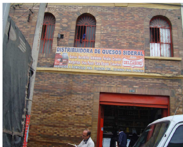
Calle. 11 NO. 17-76