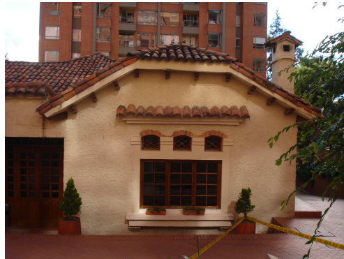
En el Conjunto Residencial de la Carrera 7 N° 5 C 86, funciona una sede social y club Administrativo.

Colegio COLSUBSIDIO: Se encontró que en el predio, de la Calle 79 B con carrera 4 N° 4 – 26, Dirección antigua Calle 80 N° 4 46, (Colegio COLSUBSIDIO), se encuentra clasificado como bien de interés cultural con categoría de conservación tipológica, sin embargo, el propietario de dicho predio presentó una licencia para ampliación, adecuación, modificación y reforzamiento estructural para su remodelación, lo cual afectará el bien y se cambiará su clasificación. Por otra parte, se desarrollará un cerramiento y 60 unidades de vivienda en 8 pisos de altura, un sótano y comercio vecinal, alterando el sector el cual es de categoría de conservación tipológica. Este Bien de Interés Cultural, goza de unos Beneficios los cuales cobijan a las construcciones que existen en el mismo predio y las que en el futuro se van a realizar.