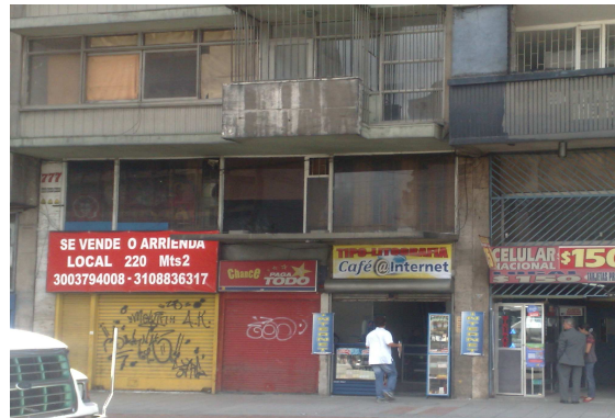
Carrera 10 19 – 26

Las fotografías anteriores, presentan algunos edificios con inadecuado o insuficiente mantenimiento ocasionando un deterioro de una parte significativa de algunas de las fachadas. La zona de influencia de estas edificaciones tiene diversos problemas urbanos, entre los que se destacan las dificultades en la movilidad vehicular generando congestión, contaminación y problemas en la accesibilidad, carencia de estacionamientos, existencia de usos en comercio que no responden a la viabilidad de las edificaciones ocasionando afectaciones en las mismas. Pese a la ubicación central de los edificios se encuentran desocupados, en arriendo o venta.