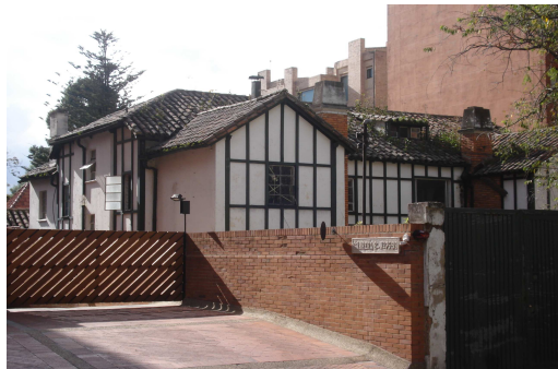
Inmueble de Cambios Unidas Carrera 8 No. 75 – 49

Pese a las protestas de los vecinos que continúan hasta el día de hoy, El Consejo Asesor de Patrimonio Distrital les dio la razón a los propietarios y conceptuó excluir la casa Pérez Norzagaray del inventario de Bienes de Interés Cultural. Los vecinos, que eran parte interesada, cuando compraron sus apartamentos en los edificios contiguos, tuvieron que someterse a las reglas de propiedad horizontal aplicadas para los inmuebles que se construyan alrededor de un bien de interés cultural que se protege como patrimonio del Distrito.