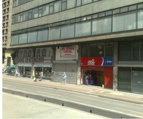
Carrera 10 24 – 49