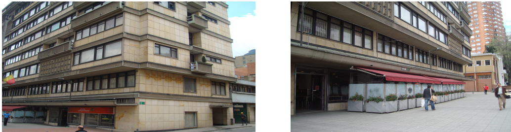
Calle. 40 No. 8 – 92

Decreto 606 de 2001. Así mismo, la Alcaldía Local, no da cumplimiento a su función de acuerdo a lo establecido en el artículo 86, del Estatuto Orgánico de Bogotá -Decreto Ley 1421 de 1993, que dice: “ (...) es función de los alcaldes locales vigilar el cumplimiento de las normas vigentes sobre desarrollo urbano, uso del suelo y reforma urbana ”.