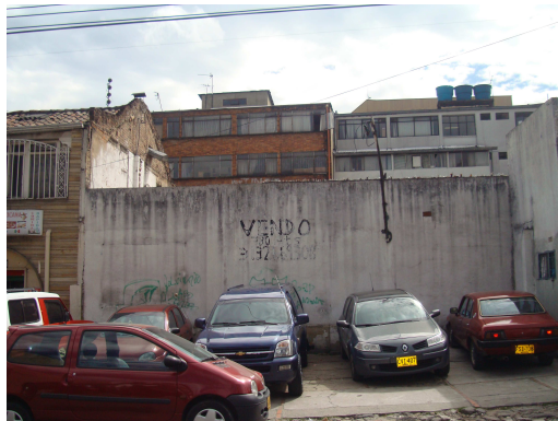
Calle 33 A No. 13-30

Con relación al inmueble que ocupa nuestra atención, según Visita Administrativa de carácter Fiscal, llevada a cabo por la Contraloría de Bogotá, D.C., en el mes de junio de 2011, se constató que el predio está totalmente demolido. Hechos de los cuales da cuenta el siguiente registro fotográfico: