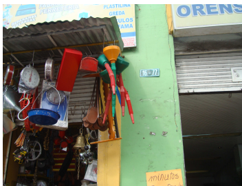
Calle. 11 No. 16-76

A continuación se presentan fotografías de algunos Bienes incluidos como de Interés Cultural, los cuales han sido intervenidos sin permiso y en detrimento del Patrimonio Cultural, así: