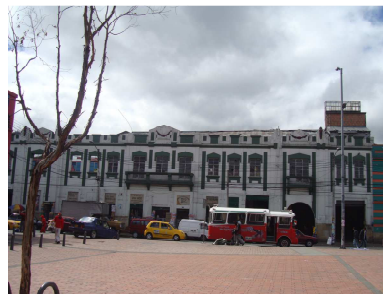
Carrera. 18 No. 11/36/38/40/42

En visita realizada a los Bienes de Interés Cultural del sector comprendido entre la Calle 11, entre Carreras 14 y 18, barrio, Voto Nacional, Localidad de los Mártires, se observó que la mayor parte de los inmuebles conservan sus fachadas, pero en su interior han sido demolidos o remodelados para el almacenamiento de mercancías, intervenciones que se han realizado sin autorización ni control de las autoridades respectivas. En estas edificaciones es difícil encontrar elementos originales, ocasionalmente se conservan pero sin mantenimiento y en otros casos los artefactos utilizados son fabricados en la actualidad, sin tener en cuenta su datación. Por ser un sector comercial, un porcentaje elevado de los BIC se encuentra cubiertos de vallas, inobservando lo establecido en el artículo 7° del